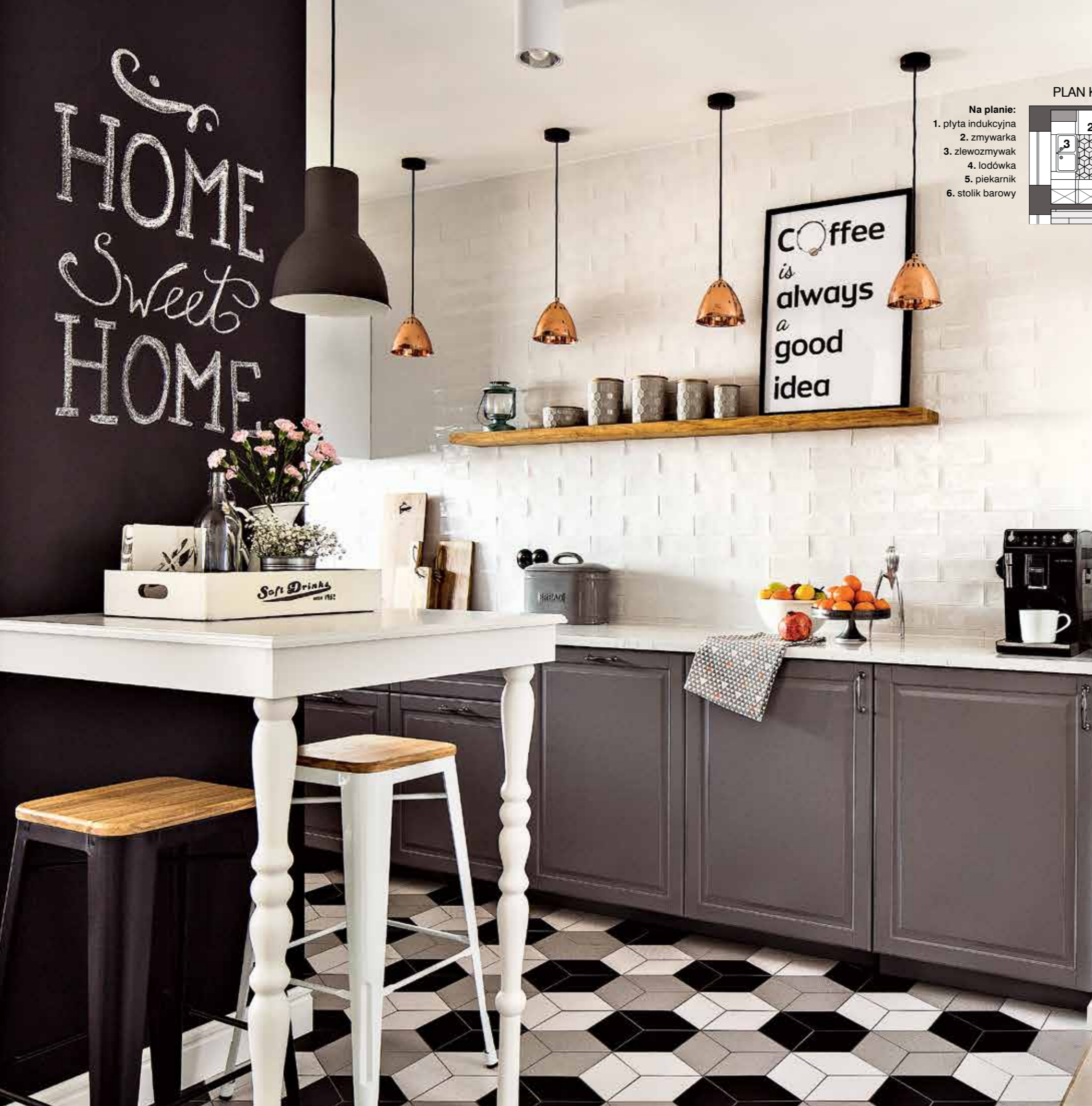
PLAN KUCHNI 12 m 2